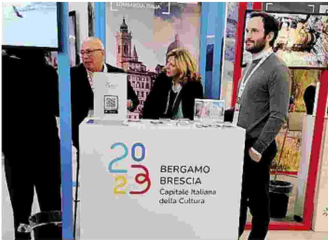
Il desk di Bergamo-Brescia Capitale italiana della Cultura alla Bit